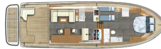
Linssen 50 SL Sedan Variodeck