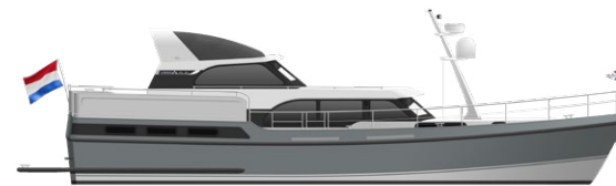
Linssen 50 SL AC Variotop®