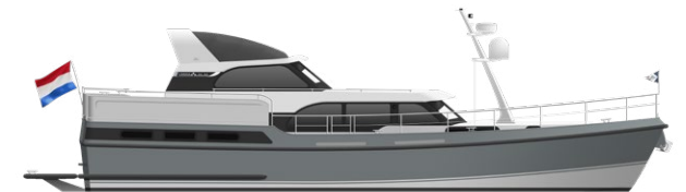
Linssen 55 SL AC Variotop®